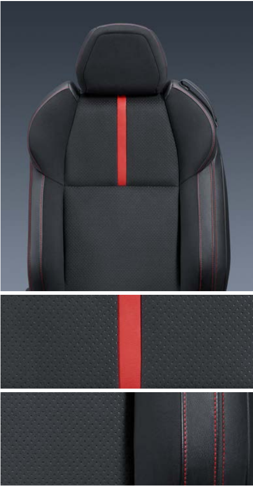
Sitze aus Echtleder und Ultrasuede®**