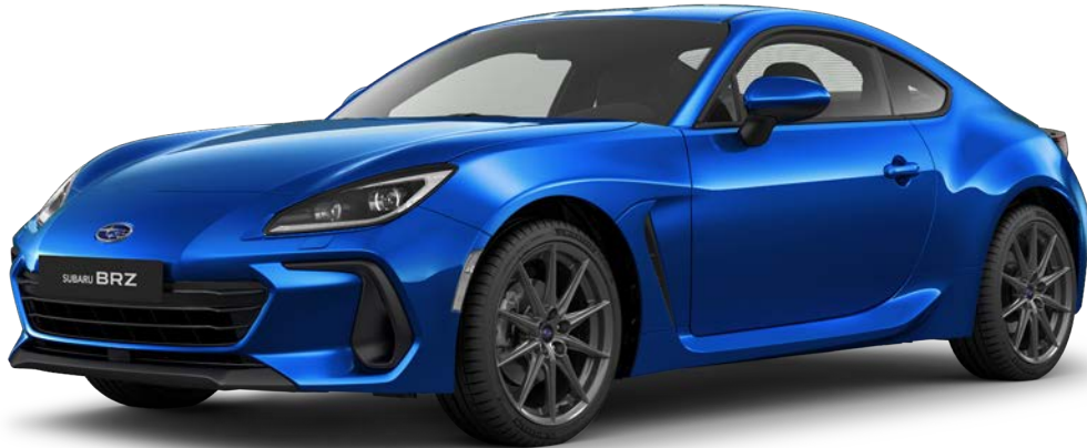
WR Blue Pearl

ABMESSUNGEN: L x B x H: 4.265 x 1.775 x 1.310 mm MOTOR: SUBARU BOXER, 4 Zylinder, DOHC, 16 Ventile HUBRAUM: 2.387 ccm MAX. LEISTUNG: 172 kW (234 PS) bei 7.000 U/min MAX. DREHMOMENT: 250 Nm bei 3.700 U/min ANTRIEB: 6-Gang-Schaltgetriebe, Heckantrieb KRAFTSTOFFVERBRAUCH* (l/100 km): nach NEFZ-Messverfahren: innerorts: 13,3, außerorts: 7,3, kombiniert: 9,5 nach WLTP-Messverfahren: bei Geschwindigkeit: niedrig: 13,6, mittel: 8,3, hoch: 7,5, sehr hoch: 8,5, kombiniert: 8,8 CO 2 -EMISSIONEN* (g/km): nach NEFZ-Messverfahren: kombiniert: 217 nach WLTP-Messverfahren: bei Geschwindigkeit: niedrig: 308, mittel: 189, hoch: 170, sehr hoch: 192, kombiniert: 200