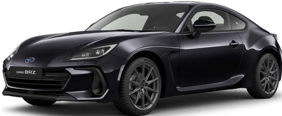
Crystal Black Silica

ABMESSUNGEN: L x B x H: 4.265 x 1.775 x 1.310 mm MOTOR: SUBARU BOXER, 4 Zylinder, DOHC, 16 Ventile HUBRAUM: 2.387 ccm MAX. LEISTUNG: 172 kW (234 PS) bei 7.000 U/min MAX. DREHMOMENT: 250 Nm bei 3.700 U/min ANTRIEB: 6-Gang-Automatikgetriebe, Heckantrieb KRAFTSTOFFVERBRAUCH* (l/100 km): nach NEFZ-Messverfahren: innerorts: 13,0, außerorts: 6,4, kombiniert: 8,8 nach WLTP-Messverfahren: bei Geschwindigkeit: niedrig: 14,9, mittel: 8,5, hoch: 7,2, sehr hoch: 8,0, kombiniert: 8,8 CO 2 -EMISSIONEN* (g/km): nach NEFZ-Messverfahren: kombiniert: 201 nach WLTP-Messverfahren: bei Geschwindigkeit: niedrig: 339, mittel: 194, hoch: 162, sehr hoch: 182, kombiniert: 199